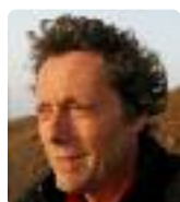
Antoine de Maximy Madagascar, l'odyssée des cimes