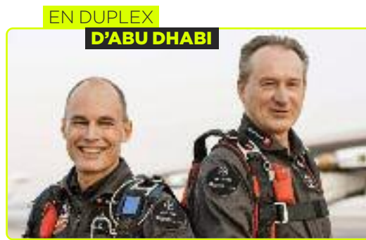
Bertrand PICCARD et André BORSCHBERG Fondateurs et pilotes de Solar Impulse