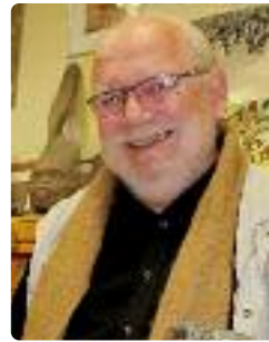
Michel BRUNET Paléanthropologue, Professeur émérite au Collège de France