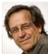
Luc-Henri FAGE Le mystère de la baleine