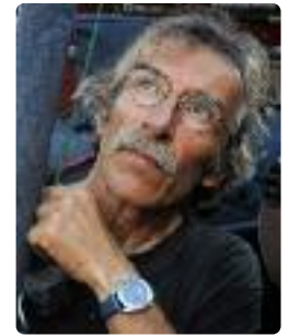
Dany CLEYET-MARREL Aéronaute, explorateur