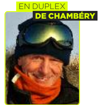
Jean-Louis ETIENNE Médecin, explorateur, écrivain